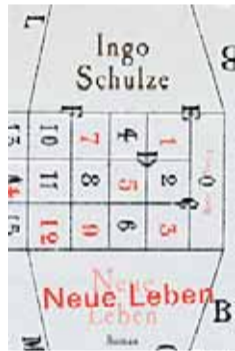
Ingo Schulze: Neue Leben. Berlin Verlag, Berlin 2005. 752 Seiten, 22 EUR.

Es gehe, so beginnt Enrico Türmer in Ingo Schulzes Roman „Neue Leben“, hier nicht um Kleinigkeiten. Es geht um den „Verrat an der Kunst, Verrat am Leben, worauf ich ihr immer entgegenhalte, nicht ich sei desertiert, sondern die Kunst“. Etwas hat sich seit dem Mauerfall im Leben Enrico Türmers verändert. Das dokumentieren die Briefe, die von Kindheit, Jugend und Militärzeit sowie von seiner ganz persönlichen Wende erzählen. Denn nach der Wiedervereinigung kehrt der Theaterdramaturg der Kunst den Rücken. In signifikant kunstloser Sprache lässt Schulze ein und denselben Vorgang in unterschiedlichen Versionen schildern, um die Facetten der Zeitgeschichte einzufangen. Überzeugend realistisch, authentisch und ohne Pathos. ela