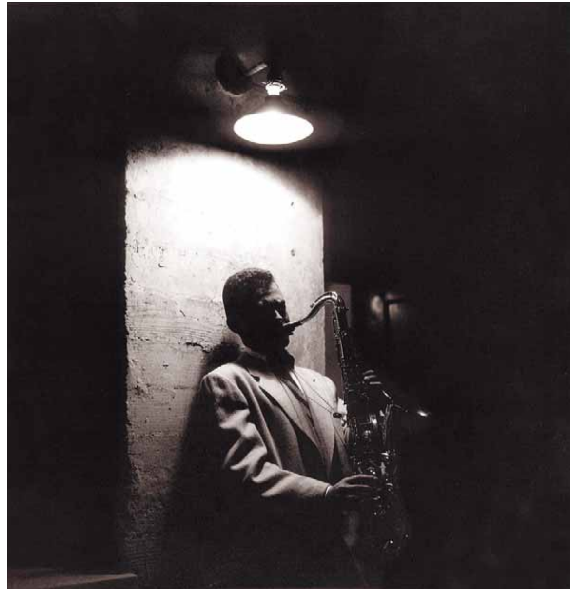
VERSPIELT: Stan Getz vor dem Bühneneingang des Clubs „Cosmo Alley“ in Hollywood.